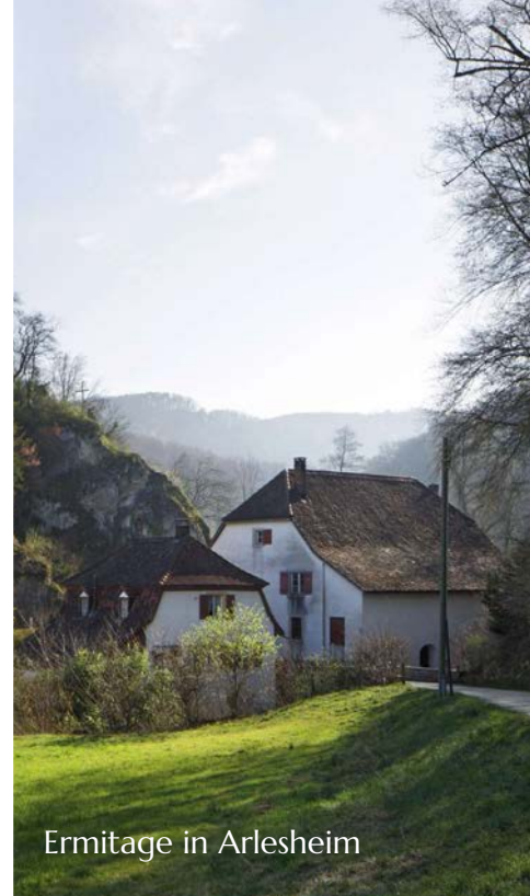
Ermitage in Arlesheim

Weitere Infos finden Sie unter www.schaulager.org